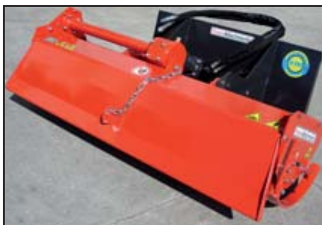
Spreader cover closed.