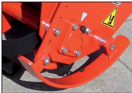
Skids depth control.