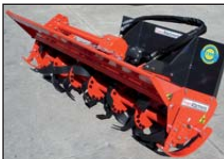
Spreader cover open.