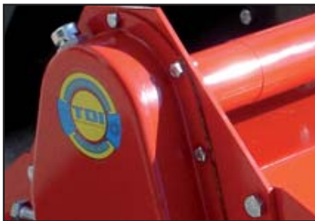
Transmission by gears.