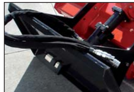
Attach for the carrier machine.